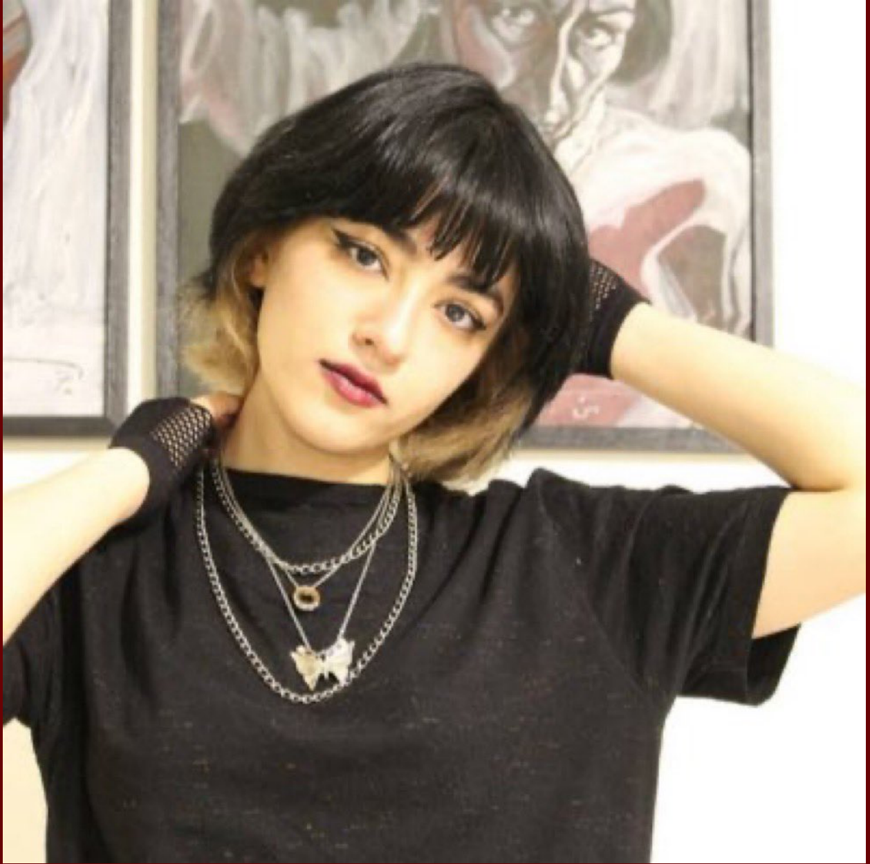
Nika Shakarami (17 Years Old); Killed in Tehran.

نیکا شاکرمی (۱۷ ساله) در تهران به قتل رسید.